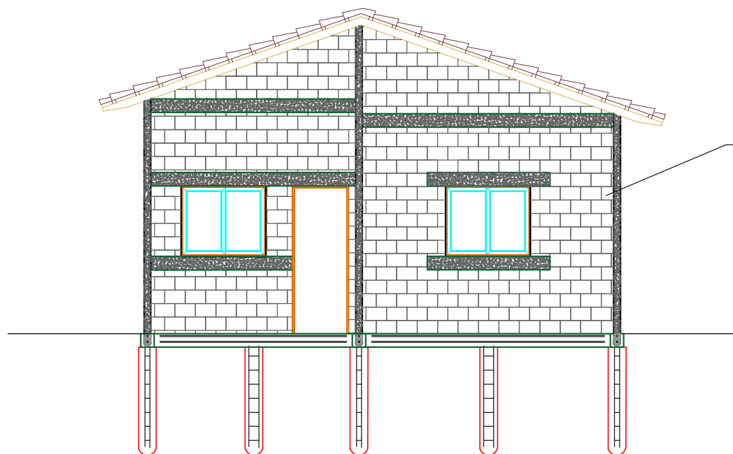
1 Corte A-A Esc: 1/75

Alvenaria de vedação Tijolo cerâmico 9 x 19 x 19 cm meia-vez